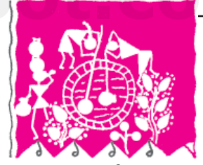
माता का अँचल